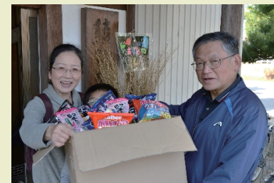
▲子ども食堂にも食材提供しています

フードバンクの活動には、食品の集荷・配布・運搬・精米・箱詰め・在庫管理など、様々な作業があります。ご協力いただける方はぜひ時間と体力の寄付をお願いします。